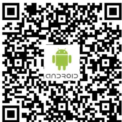
„Android“ atsisiuntimų adresai