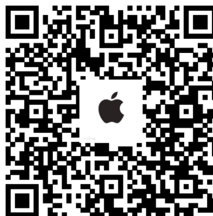
„Apple“ atsisiuntimų adresai