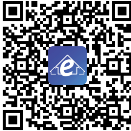
Konfigūravimo QR kodas